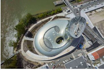
La Cité du Vin