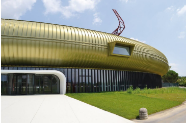
Museum Luigi Pecci