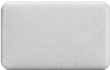
EURABUILD – SILVER METALLIC

Weitere Informationen finden Sie auf der Webseite des Architekten .