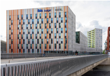
Kop van Kessel