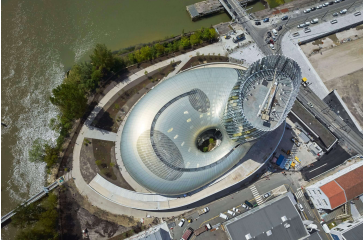
La Cité du Vin