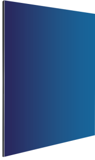
PANNEAU COMPOSITE ALUMINIUM PLAT