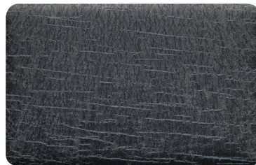
EURATEX – DESIGN SLATE STONE BLACK