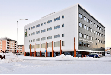
Hôtel Quality Inn