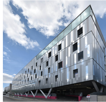
Polyclinique Bordeaux Nord Aquitaine