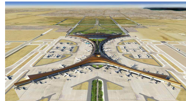
King Abdul Aziz International Airport