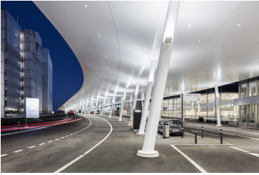
Verrière aéroport de Zurich