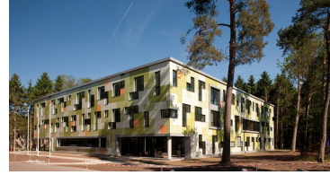
Bâtiment de l'éducation sportive Papendal