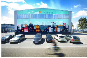
Façade Euramax Factory