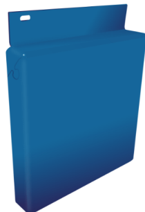
PANNEAU EN ALUMINIUM MASSIF