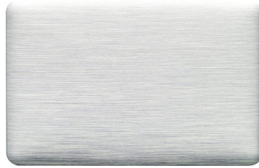
ALUNATUR – BRIGHT BRUSHED