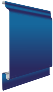
PROFIL DE PLANCHE LISSE 25/200 - 25 / 250 - 25 / 300